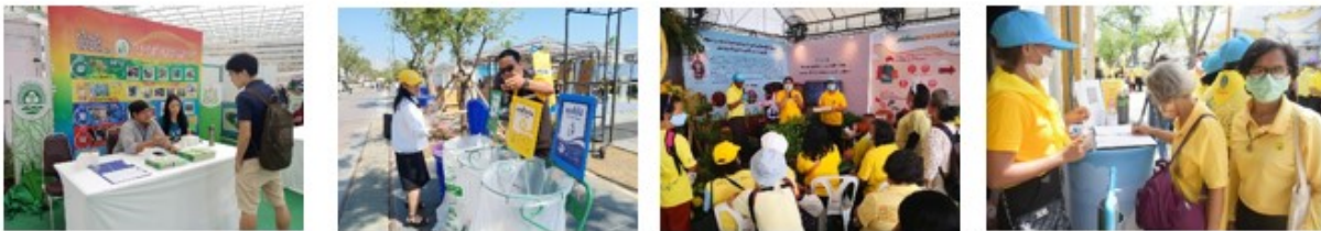
การให้บริการสื่อสิ่งแวดล้อมแก่ประชาชน ในรูปแบบสื่อนิทรรศการ การบรรยายสาธิตและฝึกอบรม